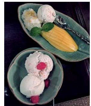
ココナッツアイス甘いもち米